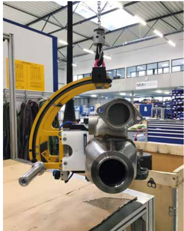
>> LAM mit Drehfunktion für Abgaswärmetauscher