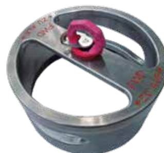
>> Aufnahme für Drehteil