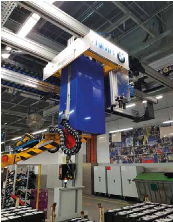
>> Handlingsgerät für PKW Batterien

>> Traggabeln, C-Bügel, C-Gabeln, Parallelspindelzangen, Scherenzangen, Sonderadapter, Traversen, Ösenhaken, Aufnahmedorne, Haken, Dreiarmgreifer, Parallelgreifer, Anschraubadapter, Wendelastaufnahme-Bügel, Sonderringschrauben, Pneumatikgreifer