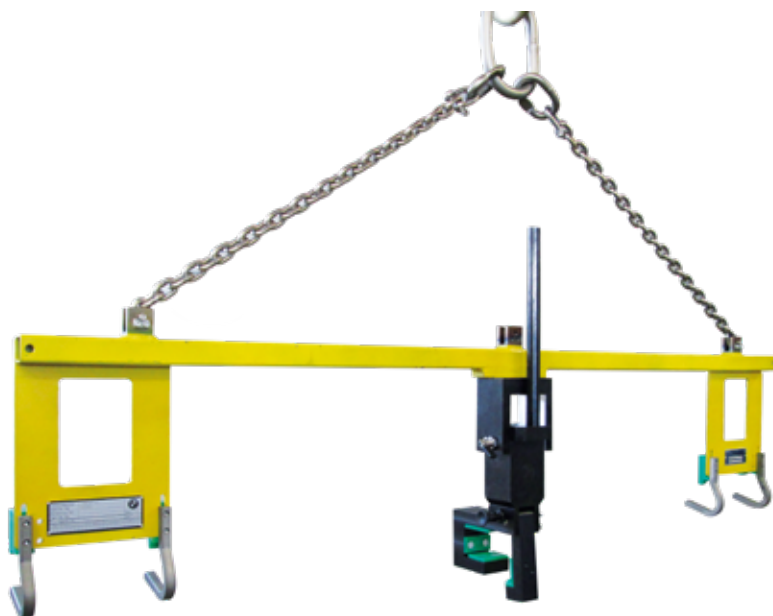
>> LAM für Lenkgetriebe