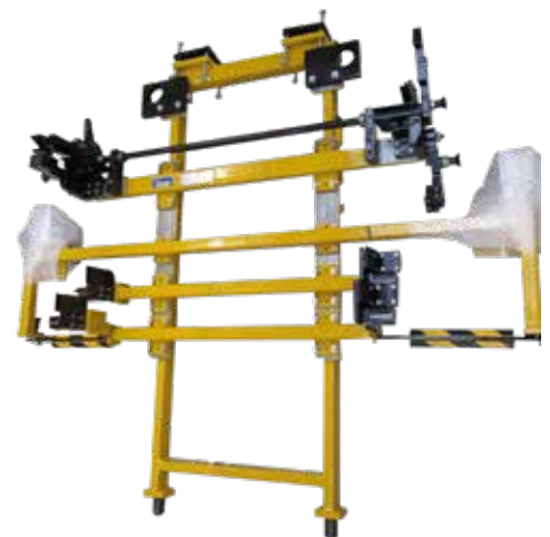
>> LAM für Frontend / Heckend