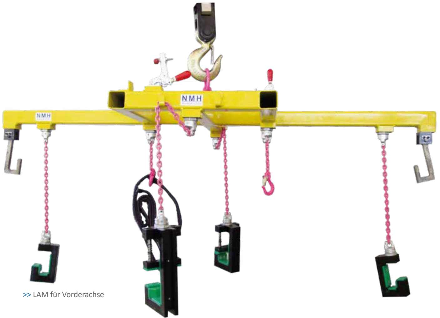
>> LAM für Vorderachse